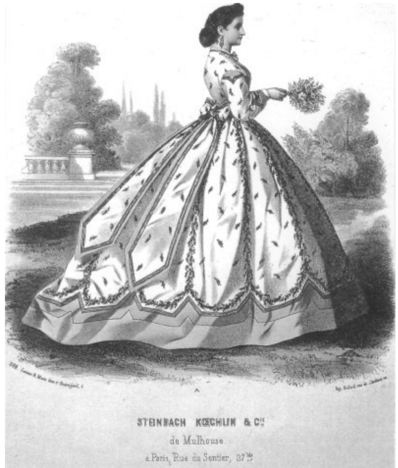
Musée de l'Impression sur Etoffes "Nouveautés 1865"